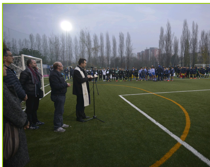
Benedizione del nuovo campo sintetico

→ Centro di ascolto. esclusivamente per famiglie residenti della parrocchia. Ogni giovedì dalle 14.30 alle 17.30. Si riceve previo appuntamento tel. 059 30-90045.