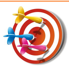
Logo del Centro estivo

Costo: 70€ a settimana comprensivo del pasto. (sconto di 5 € per i fratelli).