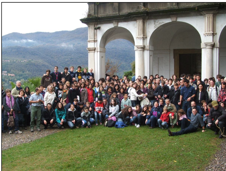
Veglia di Tutti i Santi – Lugano 2008