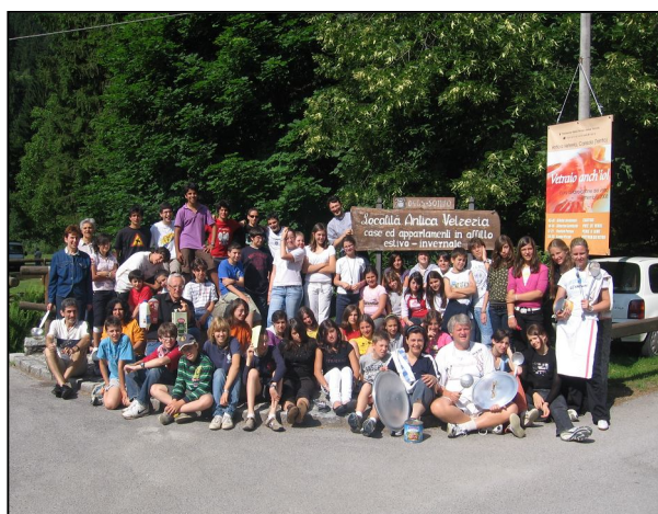
Gruppo medie - Pinzolo

I partecipanti arrivano a fare esperienza dell'amore di Dio attraverso i Sacramenti, segni forti della presenza del Signore, e sono accompagnati ad incontrare Dio ed il Figlio suo Gesù. I ragazzi che frequentano sono circa 225 ed i catechisti, fra adulti e giovani, sono 35.