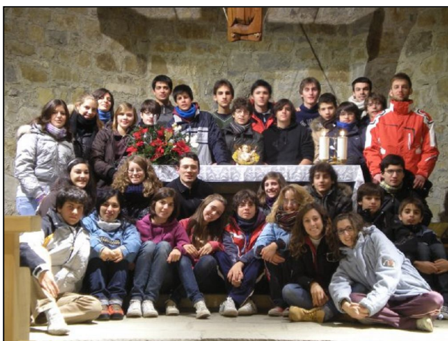
Gruppo giovani- Piane di Mocogno

È stato un sacerdote modenese impegnato nel mondo giovanile. Durante la scorsa guerra si prodigò per far riparare in Svizzera prigionieri alleati. Quando fu scoperto dai nazifascisti (tre coinvolti con lui furono fucilati e un altro sacerdote incarcerato), riparò sull'Appennino con le formazioni partigiane. Catturato mentre si indugiava ad assistere un ferito, fu torturato ed ucciso a Firenze. È medaglia d'oro alla memoria.