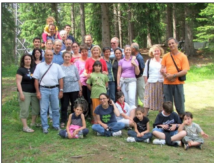
Gruppo sposi- Moena

Queste sono le date delle prossime feste mensili: - 21 Marzo - 18 Aprile - 16 Maggio - 6 Giugno. Per chi ha difficoltà a venire con mezzi propri è possibile ottenere il trasporto in auto telefonando ai numeri indicati nell'invito di ogni mese. Vi aspettiamo!