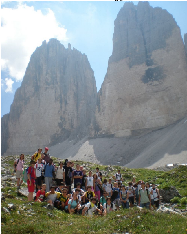
Gruppo superiori alle Tre cime di Lavaredo

L'esperienza rappresenta comunque una occasione preziosa per riunire fra loro le famiglie al completo, per fare vita comunitaria, per accogliere e conoscere nuove persone, per dialogare ed approfondire i legami di amicizia, senza distinzioni o preferenze, in una prospettiva di crescita nella fede: in una parola, per far sì che la Parrocchia diventi sempre più una "famiglia di famiglie".