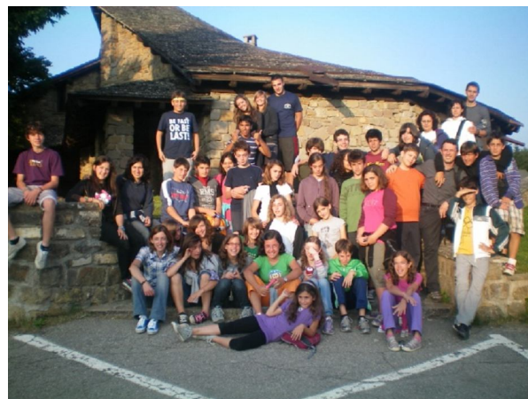
Gruppo adolescenti alle Piane di Mocogno

L'entusiasmo dell'esperienza si è protratto fino alla fine di luglio ogni mercoledì sera, quando lo spazio della sede di via Milano è stato teatro di partite di calcetto, giochi di squadra, canti e preghiera insieme per giovani di tutte le età, sia partecipi delle attività parrocchiali durante l'anno, sia attirati dalla voglia di stare insieme dalle strade e dai parchetti del quartiere.