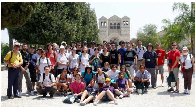
Gruppo giovani al Monte Tabor – Terrasanta

La spianata delle moschee, il muro del pianto, i vicoli dei quartieri arabo, cristiano, armeno ed ebraico diventano finalmente realtà. Un caldo pomeriggio trascorre sul Monte degli Ulivi per culminare nella meraviglia della San-