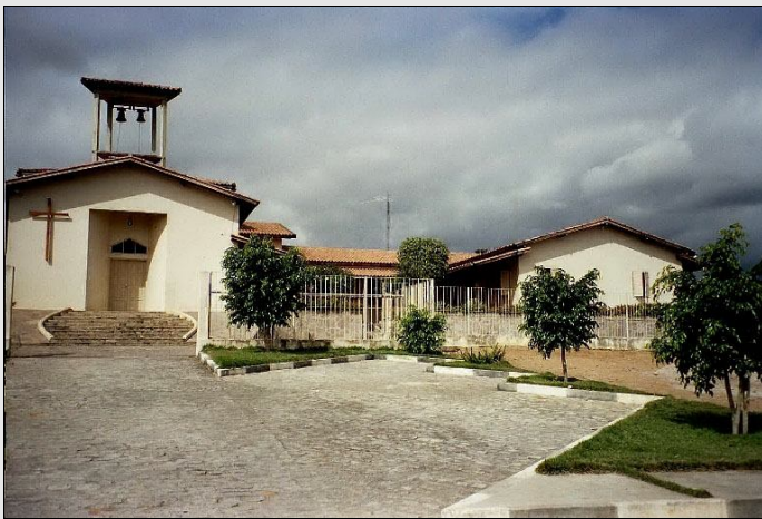
"Casa della Carità" di Ruy Barbosa (Brasile)