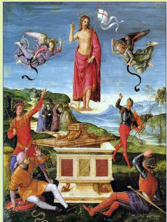
Resurrezione di Cristo (Raffaello 1483 - 1520)